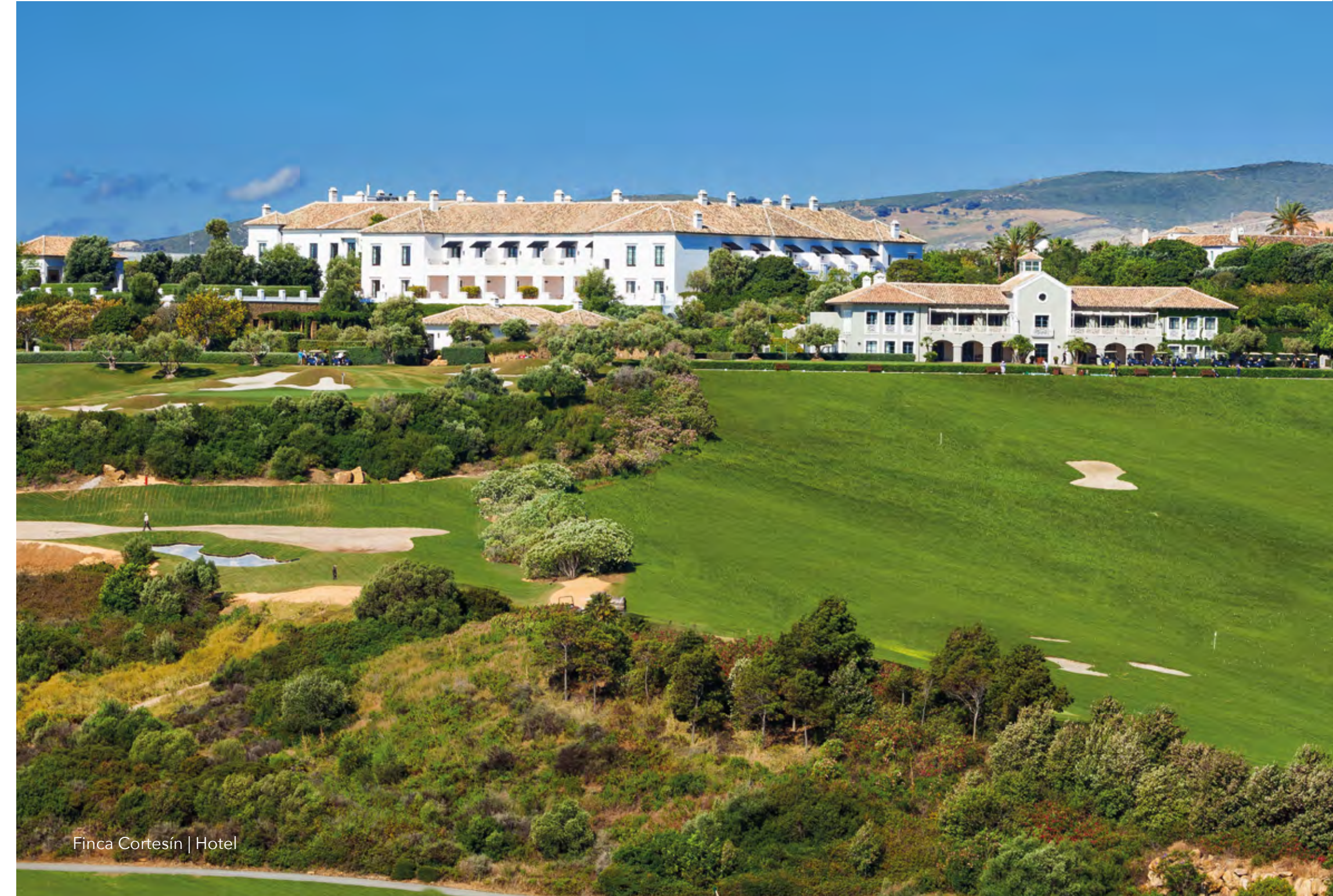
Finca Cortesín | Hotel