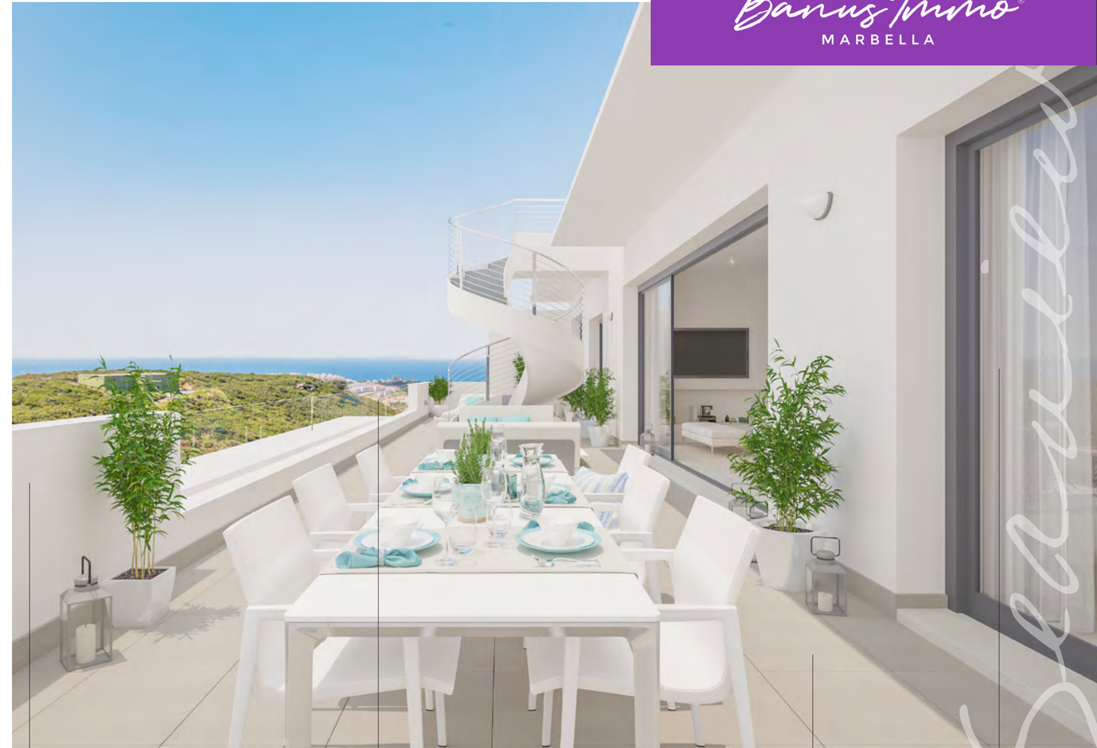
ORIENTACIÓN SUR Y SURESTE SOUTH AND SOUTHEAST ORIENTATION