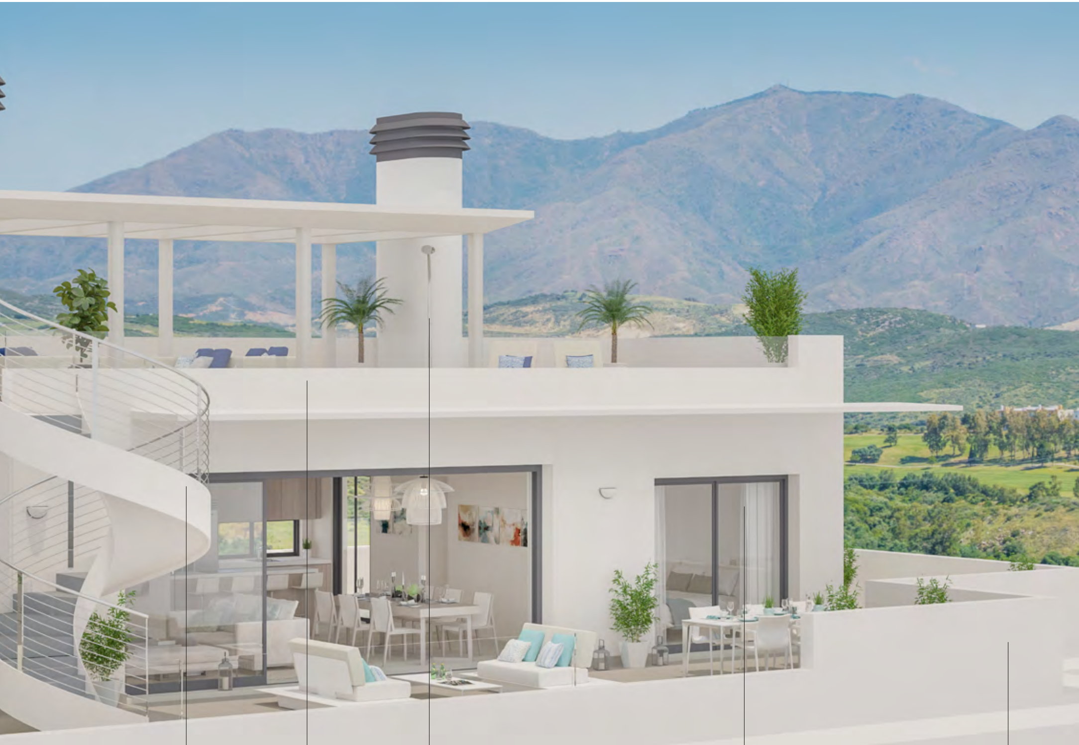
ESCALERA ESPIRAL DE DISEÑO DESIGNER SPIRAL STAIRCASE