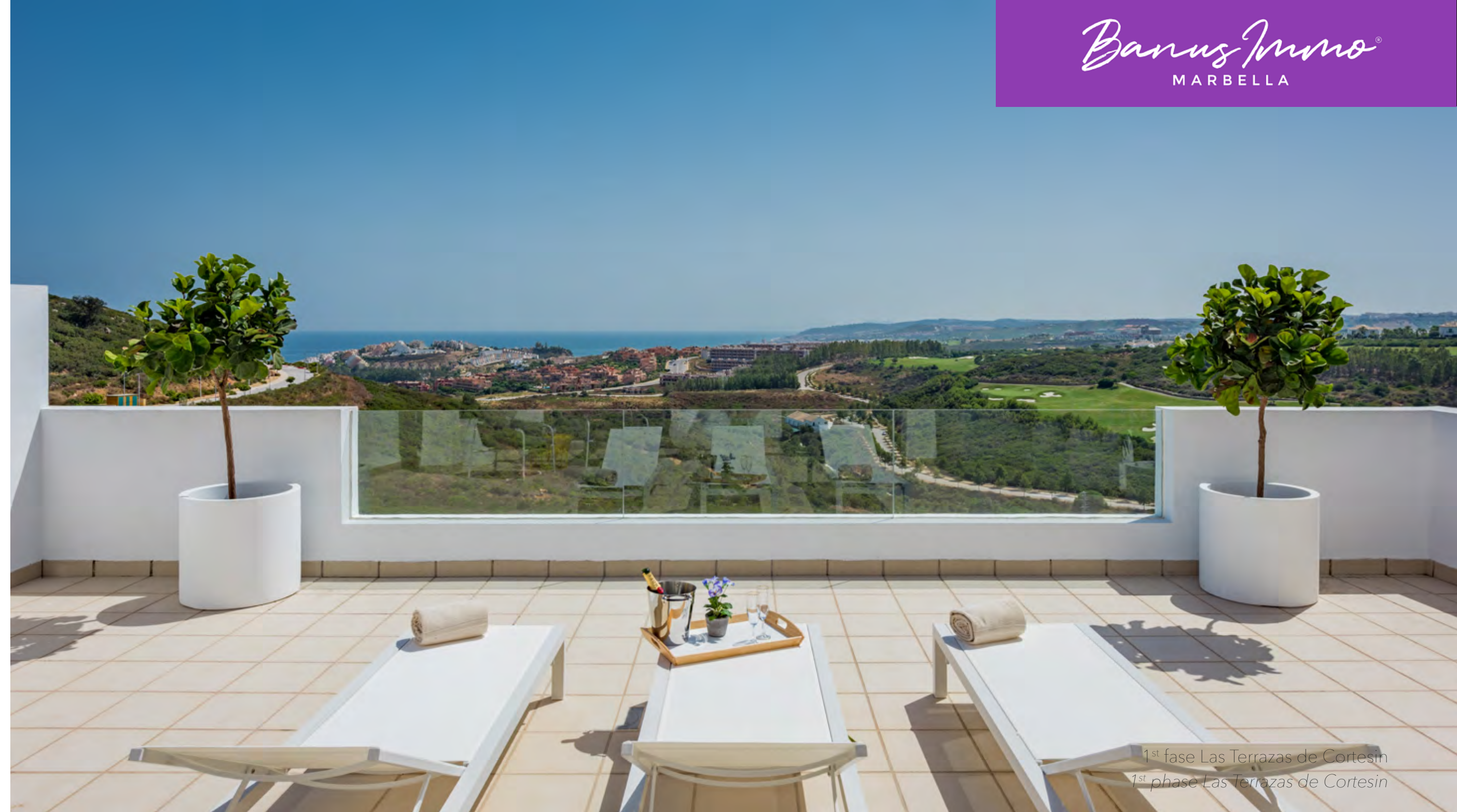
1 st fase Las Terrazas de Cortesin 1 st phase Las Terrazas de Cortesin

Ask for other possibilities of personalization of your home.