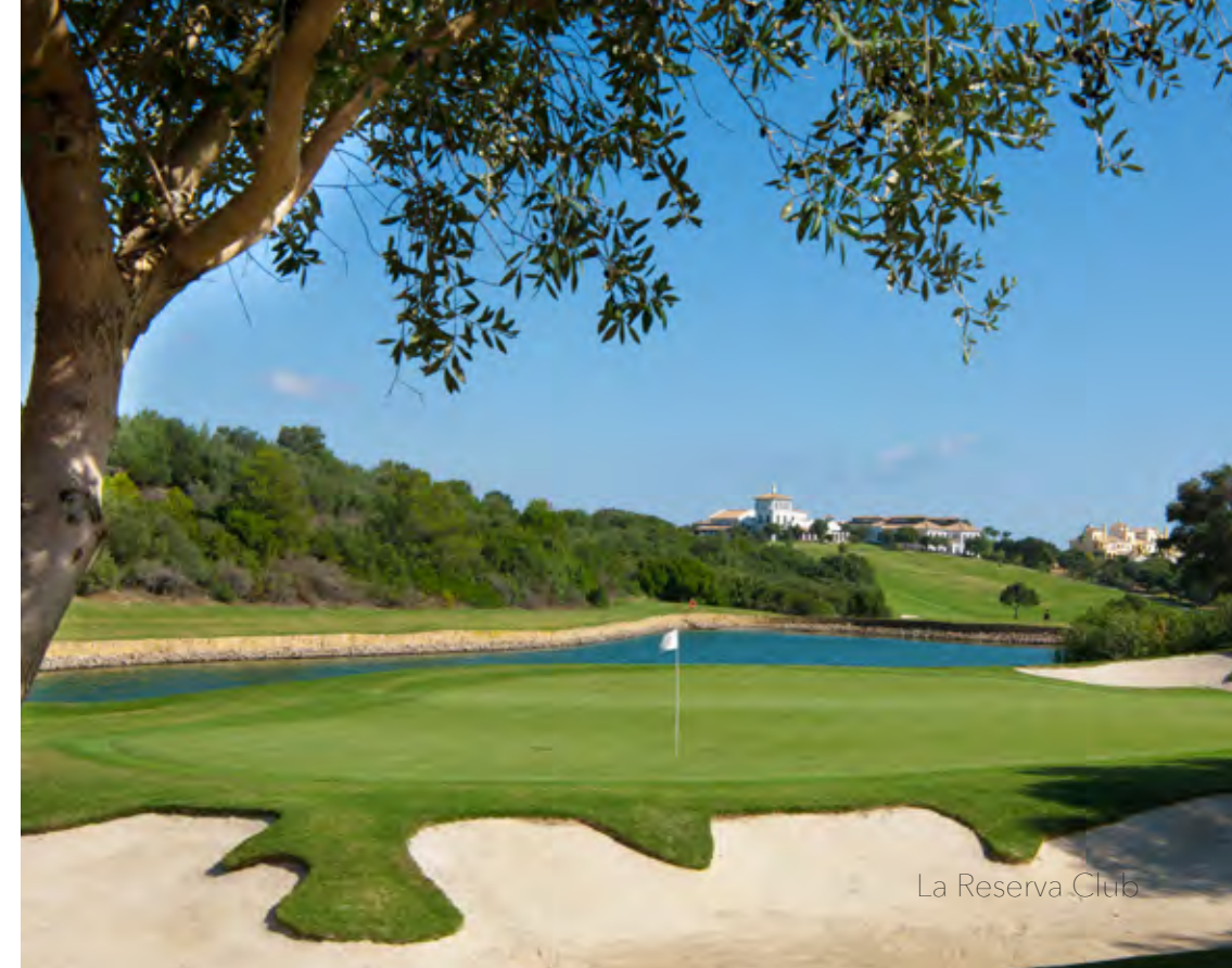
La Reserva Club