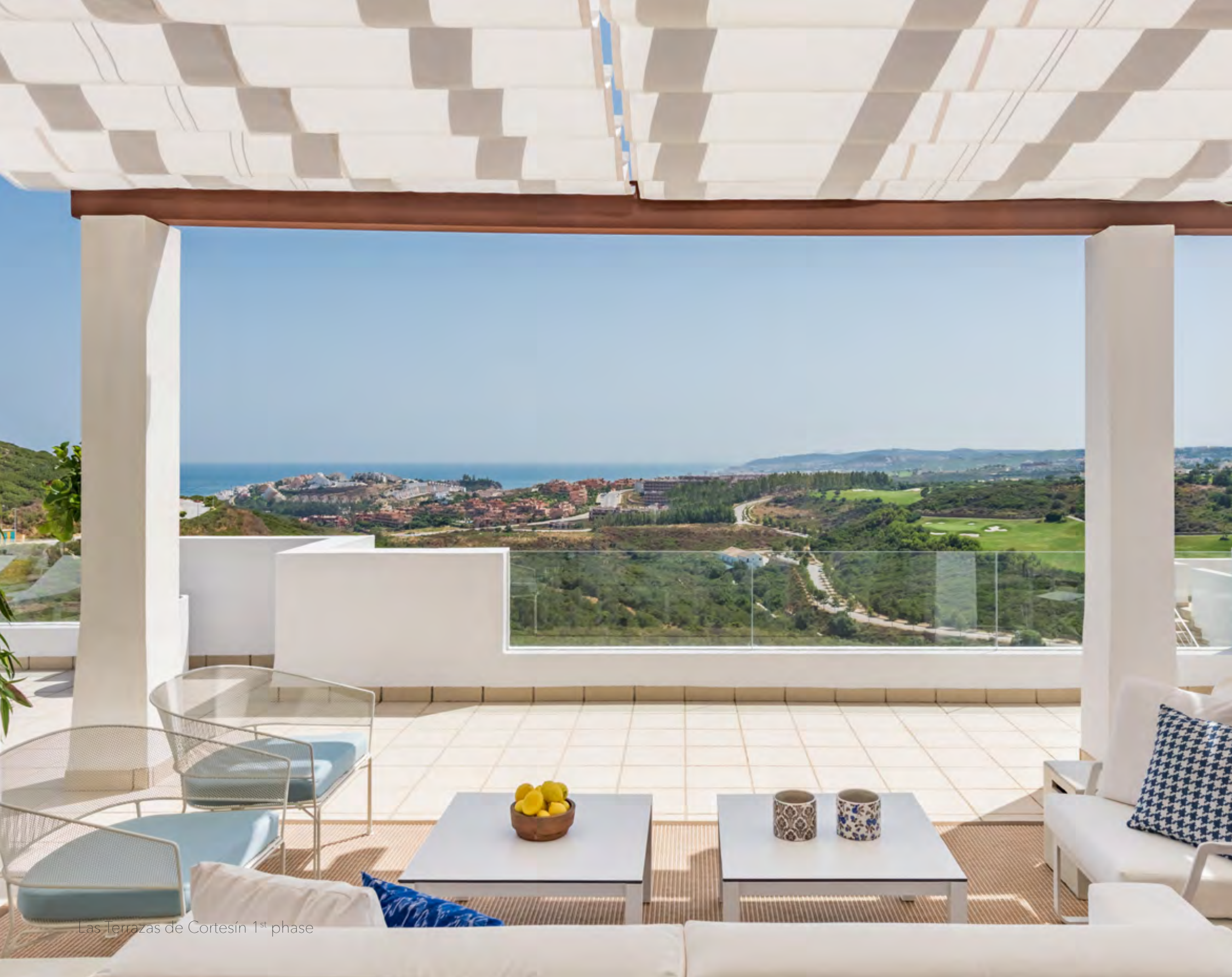
Las Terrazas de Cortesín 1 st phase