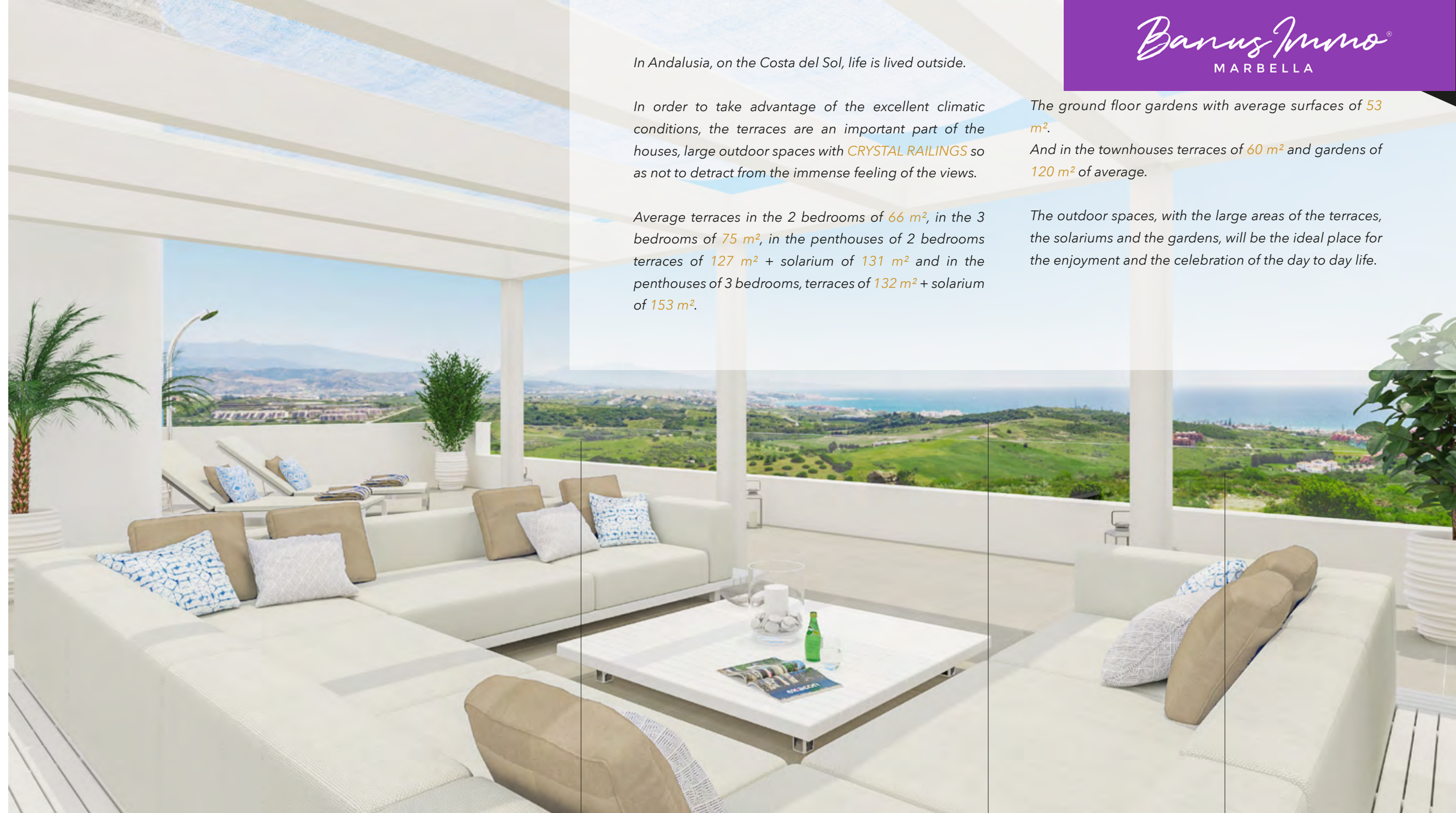
ORIENTACION SUR Y SURESTE SOUTH AND SOUTHEAST ORIENTATION

The outdoor spaces, with the large areas of the terraces, the solariums and the gardens, will be the ideal place for the enjoyment and the celebration of the day to day life.